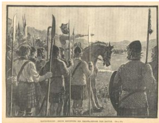
Роберт Брюс і його військо

Поеми – до них належать Русалка про дівчину, яка втопилася через нещасливе кохання (любов), Роберт Брюс - в цій поемі описана боротьба шотландського народу за самостійність. Шість разів Роберт Брюс підіймав повстання проти англійського короля, але тільки за сьомим разом повстання закінчилося успіхом. Головна ідея поеми є така – при постійних зусиллях (efforts) народ таки здобуває волю.