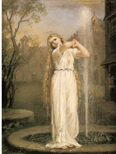
мавка – лісовий дух дівчини