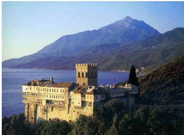
монастир на горі Атос у Греції де жив Іван Вишенський