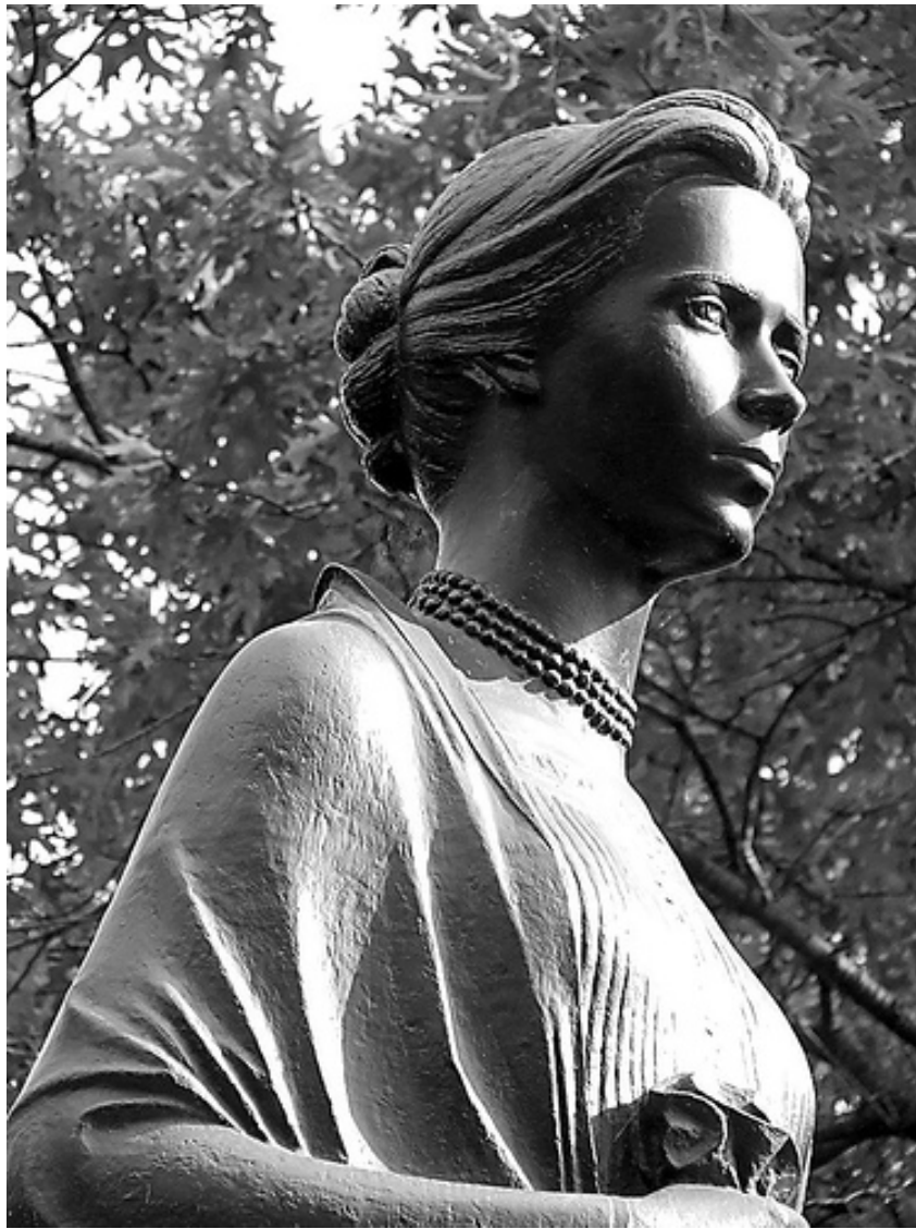
пам'ятник Лесі Українки в Торонто – робота Михайла Черешньовського