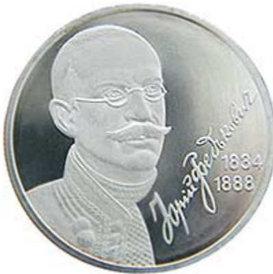
монета (coin) з портретом Юрія Федьковича