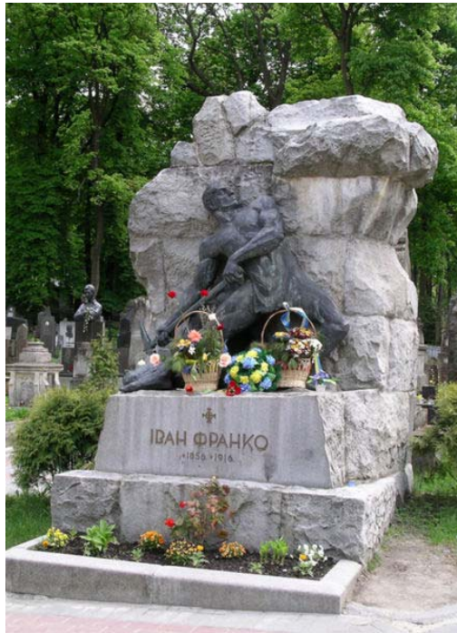
пам'ятник у формі Каменяря на могилі (grave) Івана Франка