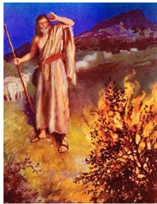
Мойсей і горючий кущ

українці боролися і віддавали своє життя за Україну і відповідає, що він вірить у силу духа українського народу. Він вірить, що прийде час коли український народ буде вільним і буде господарем на своїй землі. Друга частина поеми розповідає про Мойсея , який веде ізраїльтян з неволі в Єгипті до їхньої батьківщини в Палестині. Вже сорок років блукають вони в пустині (desert) і врешті наближаються до Палестини. Та народ не хоче вже слухати Мойсея. Люди проганяють Мойсея з табору. Мойсей і сам починає сумніватися (have doubts) і тому помирає не дійшовши до Палестини. Та приходить новий провідник і провадить народ до їхньої батьківщини.