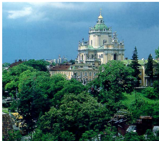
катедра (церква) св. Юра у Львові