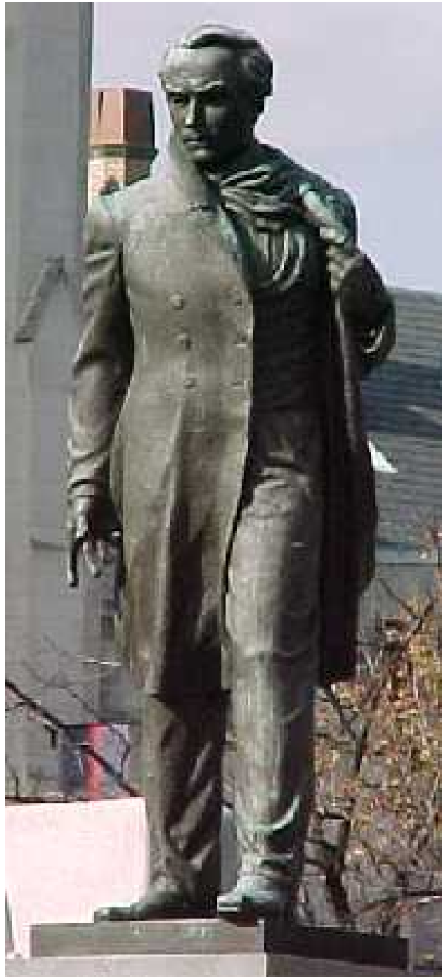
пам'ятник Шевченка у Вашингтоні