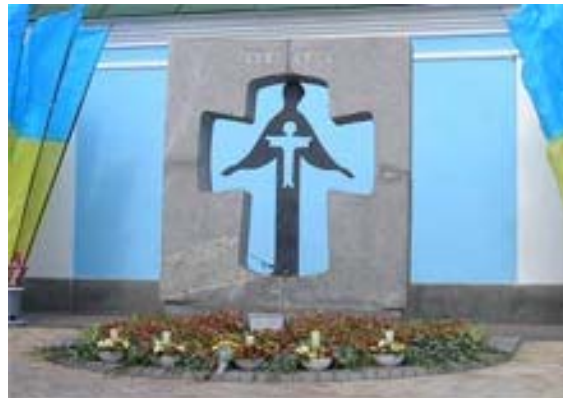
пам'ятник жертвам Голодомору